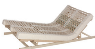
Sitz- und Fußhochstellung