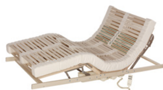
Motorrahmen mit Netzfreeschaltung